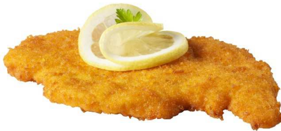
Puten-Schnitzel Wiener Art

Echtes Schnitzel – wie gewachsen. Aus der ganzen Putenbrust geschnitten, delikat gewürzt, dünn paniert und knusprig gebraten. Kalt und warm ein Genuss